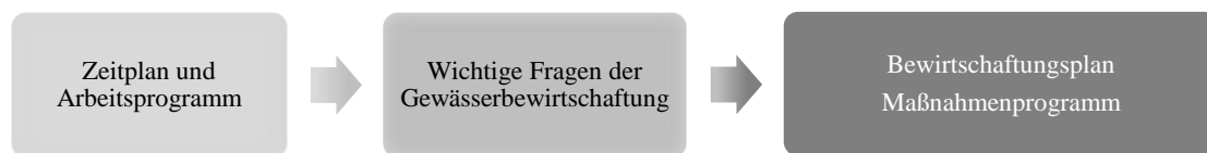
Abbildung 1: Anhörungsphasen

Die Information, Anhörung und Beteiligung der Öffentlichkeit ist ein verbindlicher Bestandteil der WRRL. Wie im ersten und zweiten Bewirtschaftungszeitraum ist auch für den dritten Bewirtschaftungszeitraum ein dreistufiges Anhörungsverfahren vorgesehen, an dem Sie sich aktiv beteiligen können.